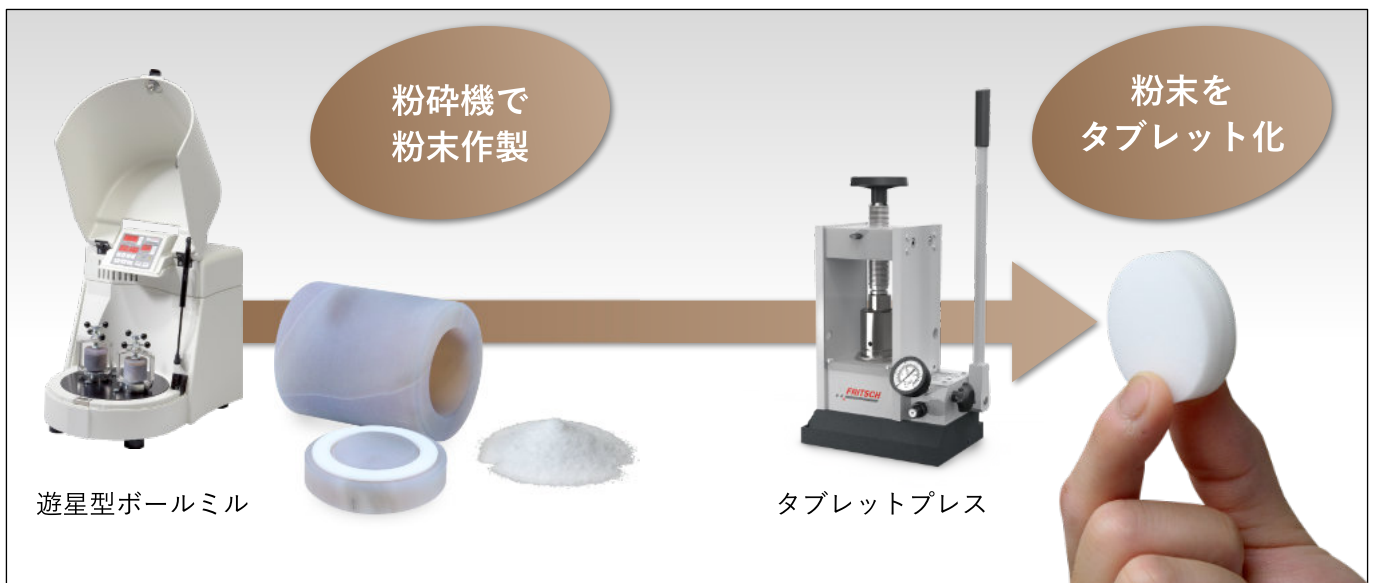
遊星型ボールミル