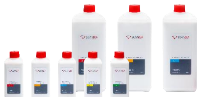
ダイヤモンドスプレー