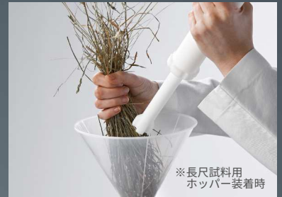
※長尺試料用ホッパー装着時

上部より試料を投入します。押込み棒によって効率よく粉碎室へ送り出します。また長尺試料用のホッパーも用意しています。